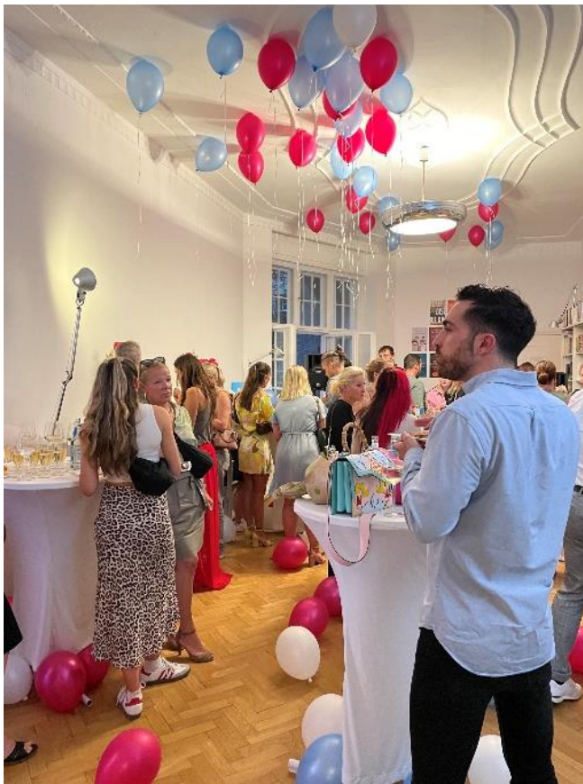
Book Release Party Anne Heinz